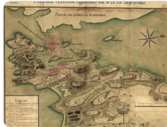
Plan de la ville, port, et rade de Newport, avec une partie de Rhode-Island occupée par l'armée française aux ordres de Mr. Le comte de Rochambeau, et de l'escadre française commandée. [?, 1780] Map.

Link: https://www.loc.gov/item/gm71002157/ .