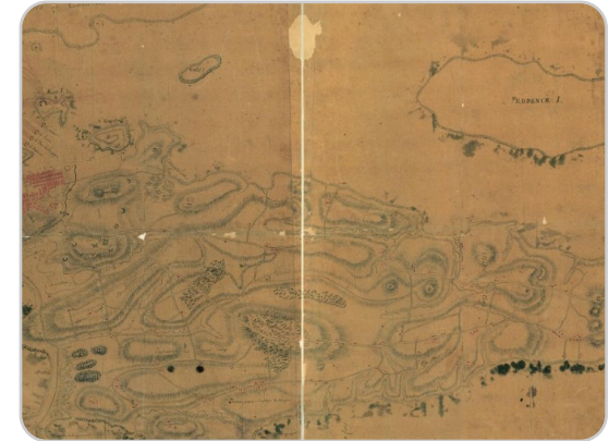
Plan de la ville, du port, et de la rade de Newport et Rhode Island. Debarquement en. [1780] Map.

Link: https://www.loc.gov/item/gm71002157/ .