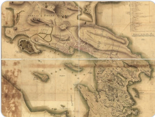
Plan de la position de l'armée française autour de Newport et du mouillage de l'escadre dans la rade de cette ville. 1780. Map.

Link: https://www.loc.gov/item/gm71002158/ .